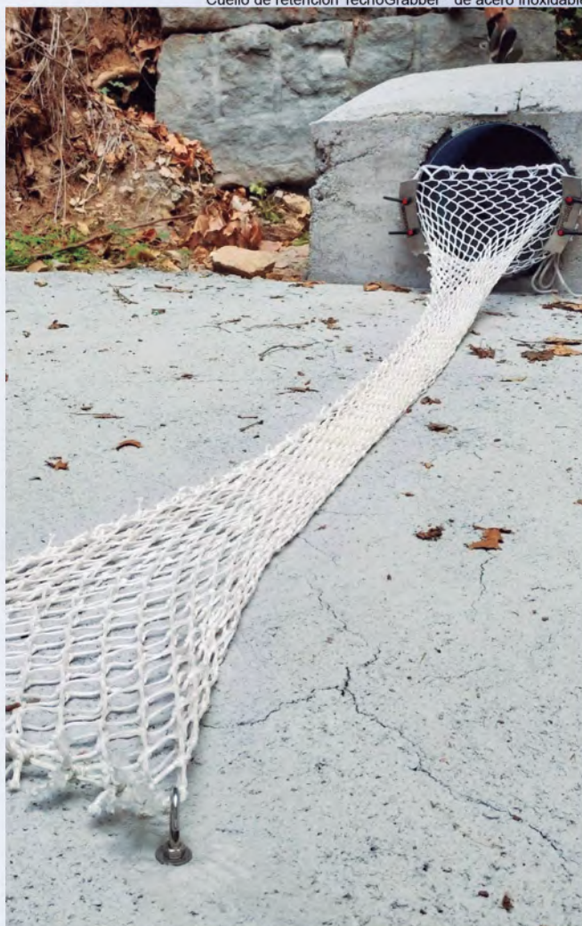
Cuello de retención TecnoGrabber® de acero inoxidable