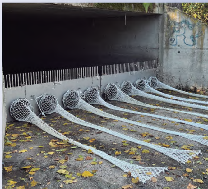
Deflector TecnoGrabber® de acero inoxidable con peine superior