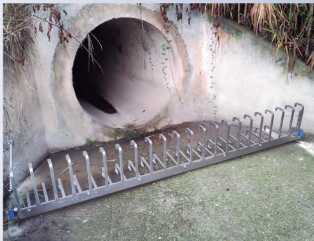
Grapas TecnoGrabber® de acero inoxidable